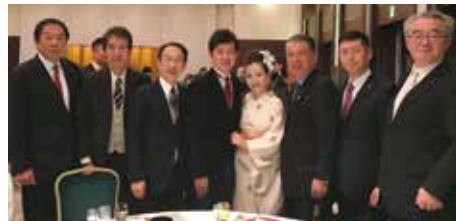
▲田畑裕明代議士結婚披露パーティー出席